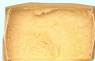
一般のノーコートアイボリー紙